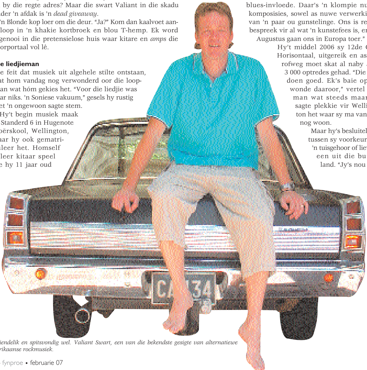
Vriendelik en spitsvondig wel. Valiant Swart, een van die bekendste gesigte van alternatiewe Afrikaanse rockmusiek.

Maar hy's besluiteloos tussen sy voorkeur vir 'n tuisgehoor of liever een uit die buitenland. "Jy's nou on-